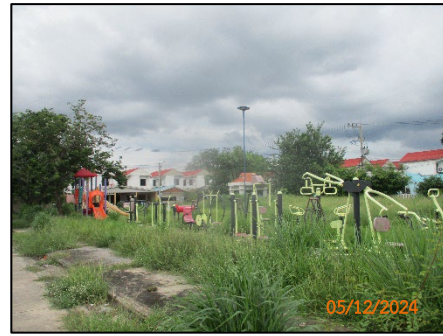
สนามเด็กเล่น