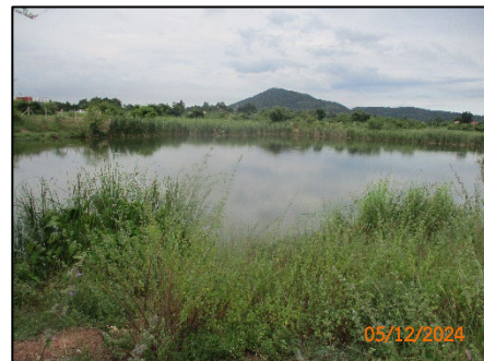
บ่อหนองน้ำ