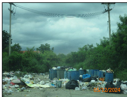
จุดทิ้งขยะภายในโครงการ รูปที่ 1-3 พื้นที่ภายในโครงการปัจจุบัน