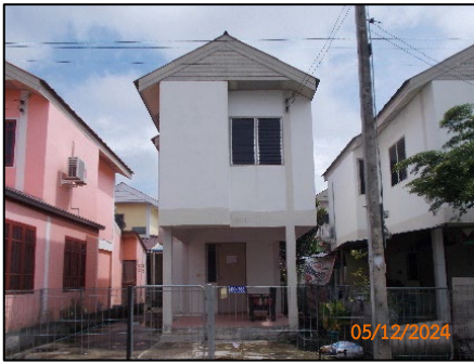
ลักษณะบ้านพักอาศัย