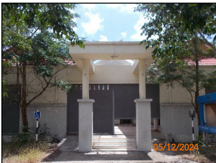
อาคารศูนย์ชุมชน