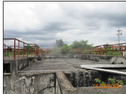
พื้นที่บ่อบำบัดน้ำเสีย