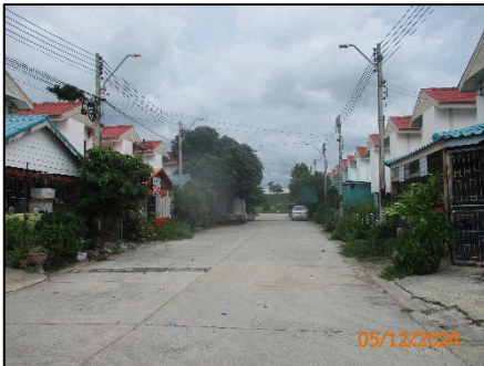
ถนนภายในโครงการ